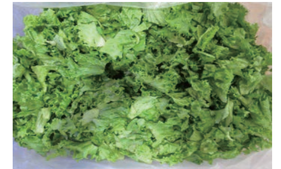
グリーンリーフ Green Leaf