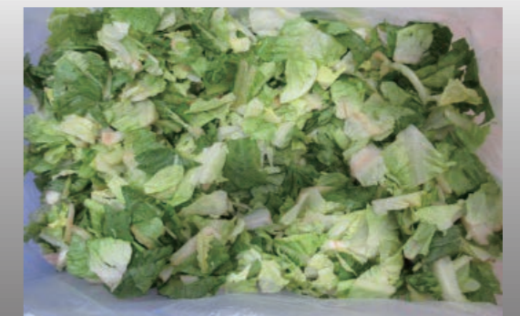
ロメインレタス Romaine Lettuce