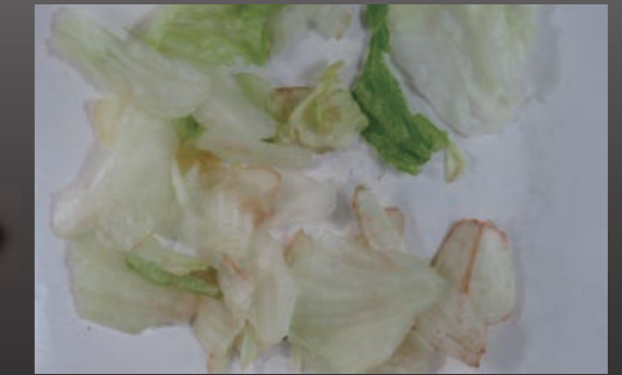
変色したレタスの除去 Rejection of Discolored Lettuce