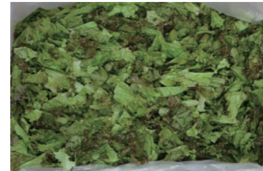
サニーレタス Sunny Lettuce

Example of Foreign Material Rejection (UDW-FF,UDW-EEFF model)