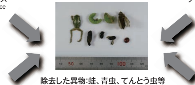
除去した異物:蛙、青虫、てんとう虫等 Rejected Foreign Materials: Frog, Worms and insects